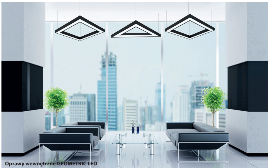
Oprawy wewnętrzne GEOMETRIC LED