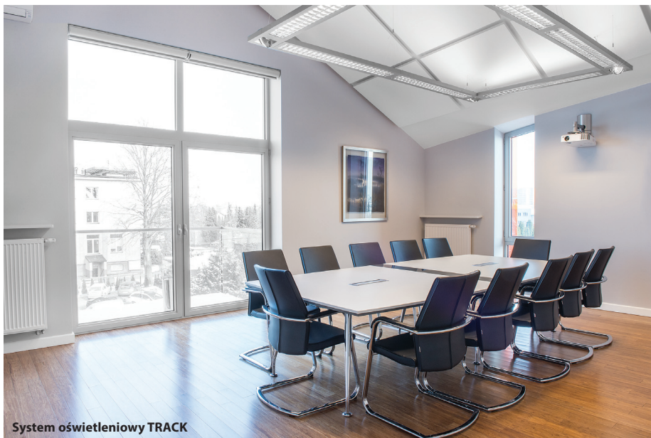
System oświetleniowy TRACK

Firma PXF Lighting powstała w 1994 roku i od początku działalności zajmuje się produkcją oraz sprzedażą opraw oświetleniowych. PXF Lighting jest członkiem Polskiego Związku Przemysłu Oświetleniowego oraz europejskiej organizacji Lighting Europe. PXF Lighting posiada 10 przedstawicielstw na terenie Polski, a także prowadzi sprzedaż do ponad 50 krajów świata.